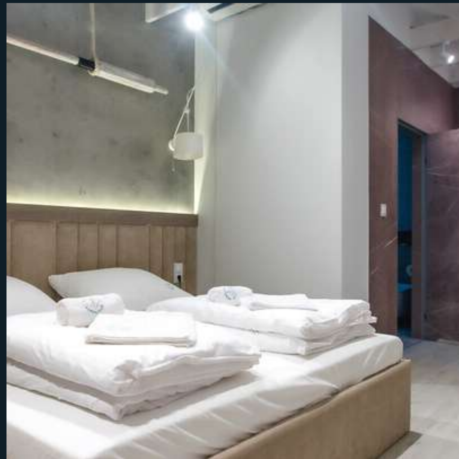
Apartamenty kapitańskie pływające

14 pokoi kapitańskich: 1 pokój 4-osobowy 13 pokoi 2-osobowych w tym 3 pokoje z możliwością dostawki (sofa)